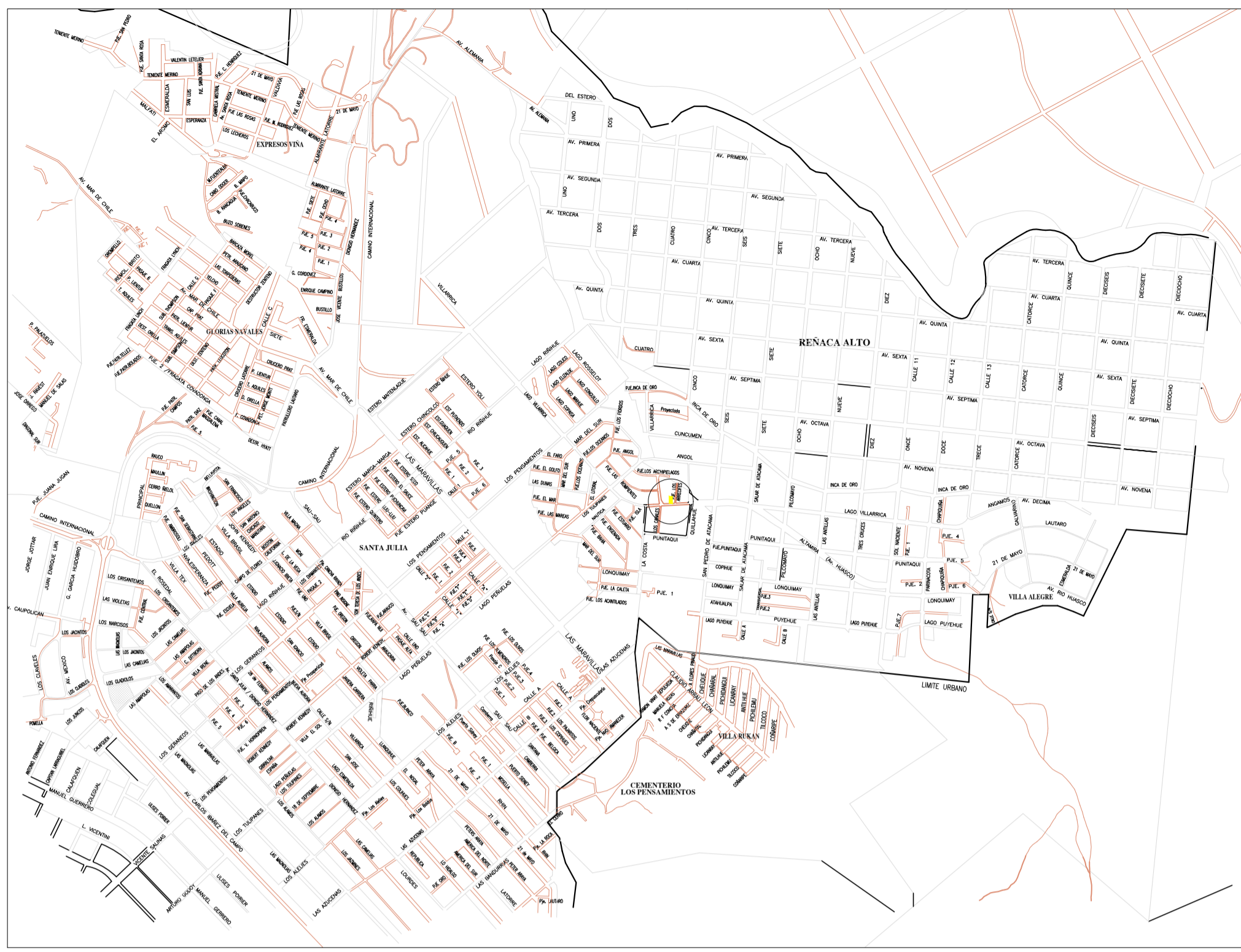
PLANO UBICACIÓN ESC.