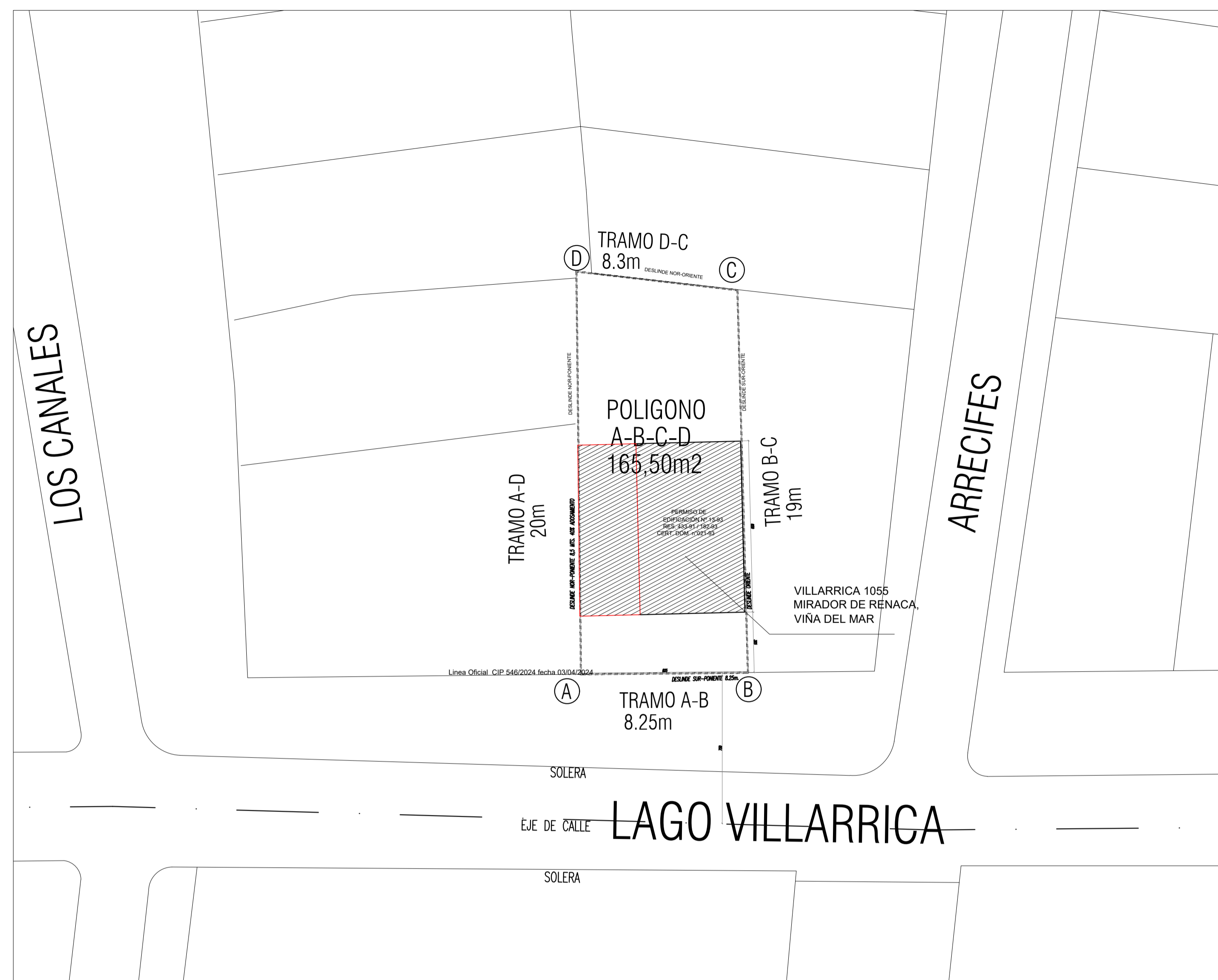
PLANO EMPLAZAMIENTO ESC.